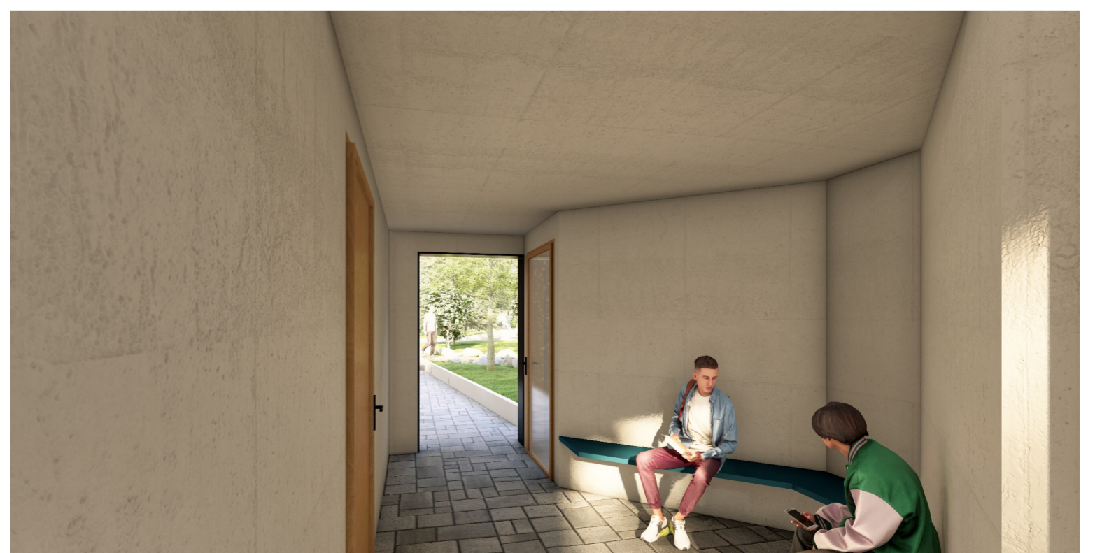
Innenraumperspektive - B2