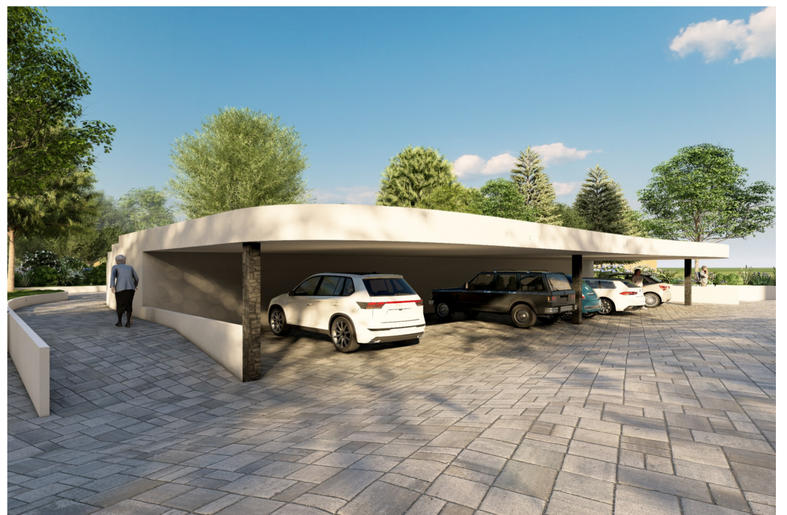
Außenraumperspektive - B1