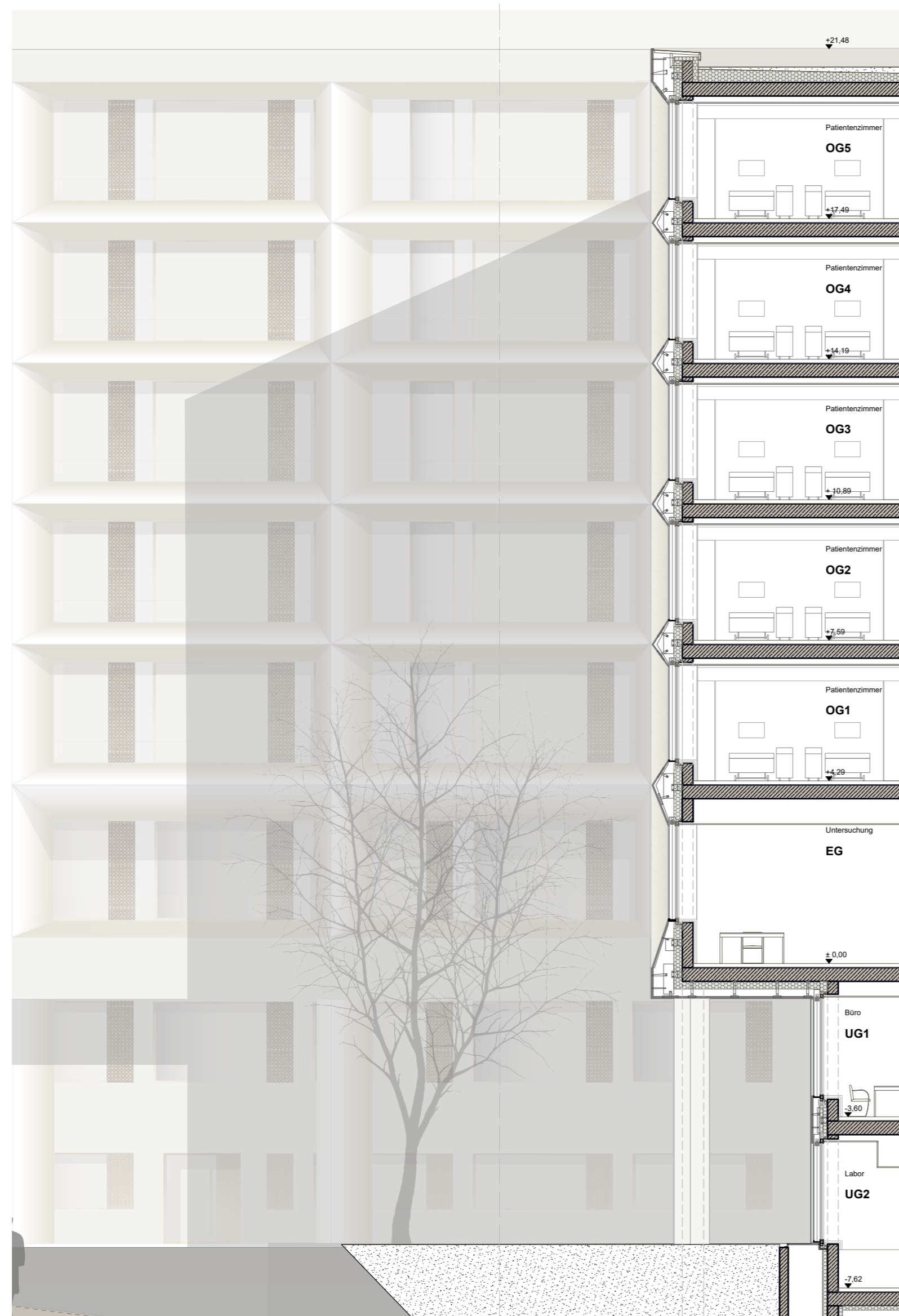
Fassadendetail | Schnitt | M 1:100

Fassade Glatte Fassade/Brüstungen/Laibungen: Naturstein Creme Royal Knotenpunkte: Massive Natursteinblöcke Creme Royal, gefräßt als Fertigteil Hinterlüftung mit Unterkonstruktion Mineralische Wärmedämmung Stahlbeton