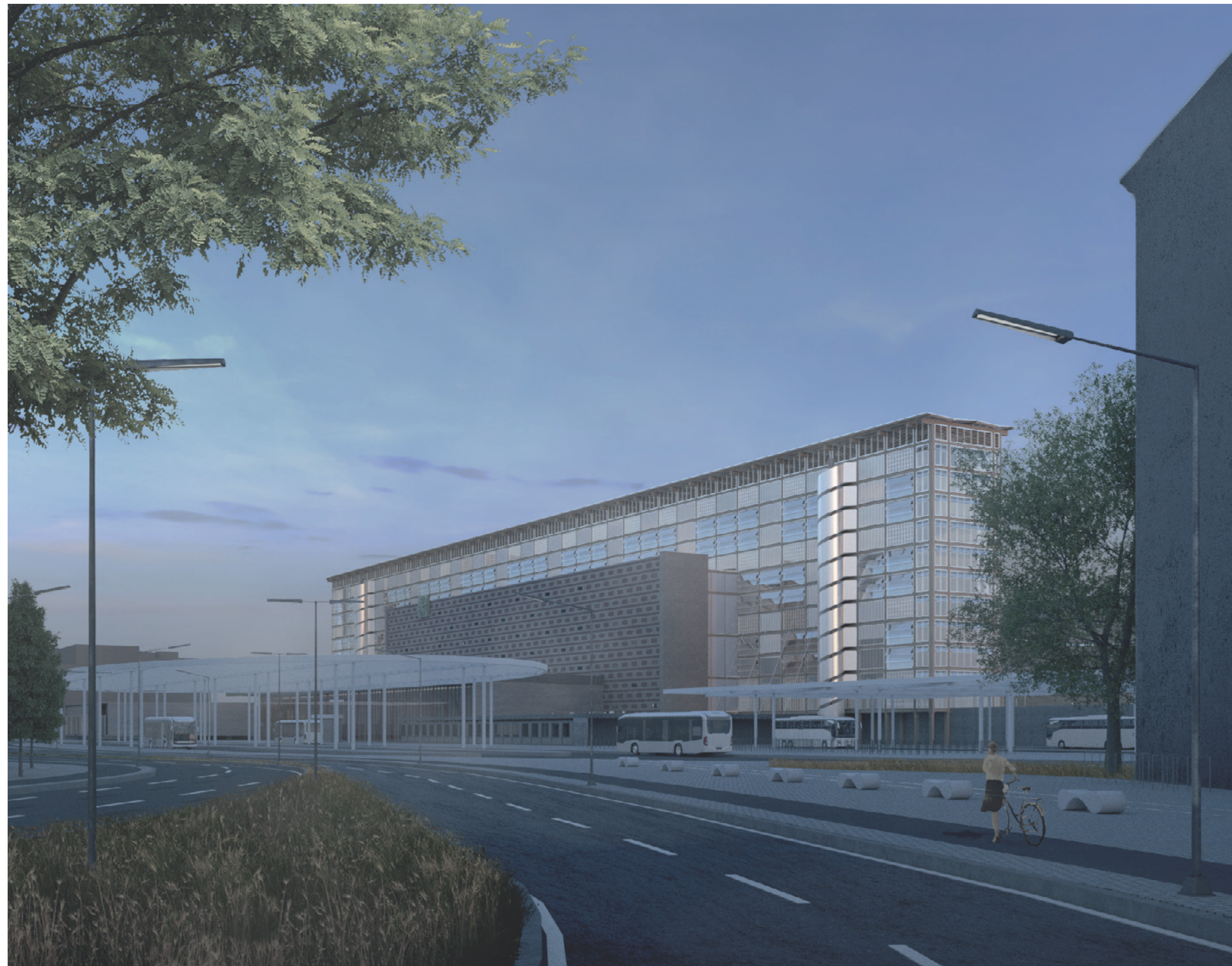
Abends im Bahnhofsquartier