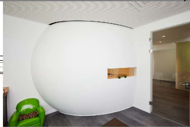
Ansicht Büro 1