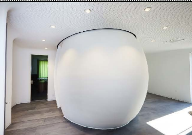
Ansicht Eingang Mitte

Fahrtbereich Vakuumhebeanlage in Hängeschienensystem z.B. FEZER, VacuPoro VP 19,00x6,00m; Uk ca. 3,00m über Ok FF