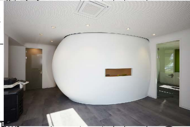
Ansicht Eingang rechts