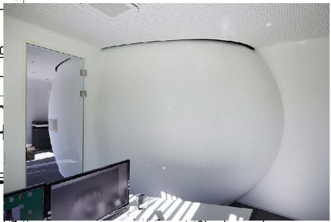
Ansicht Büro 2