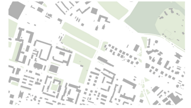
Schwarzplan mit Grünflächen