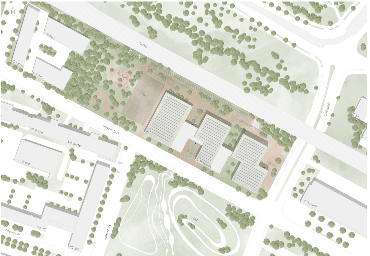
Lageplan - Ausschnitt M 1_500