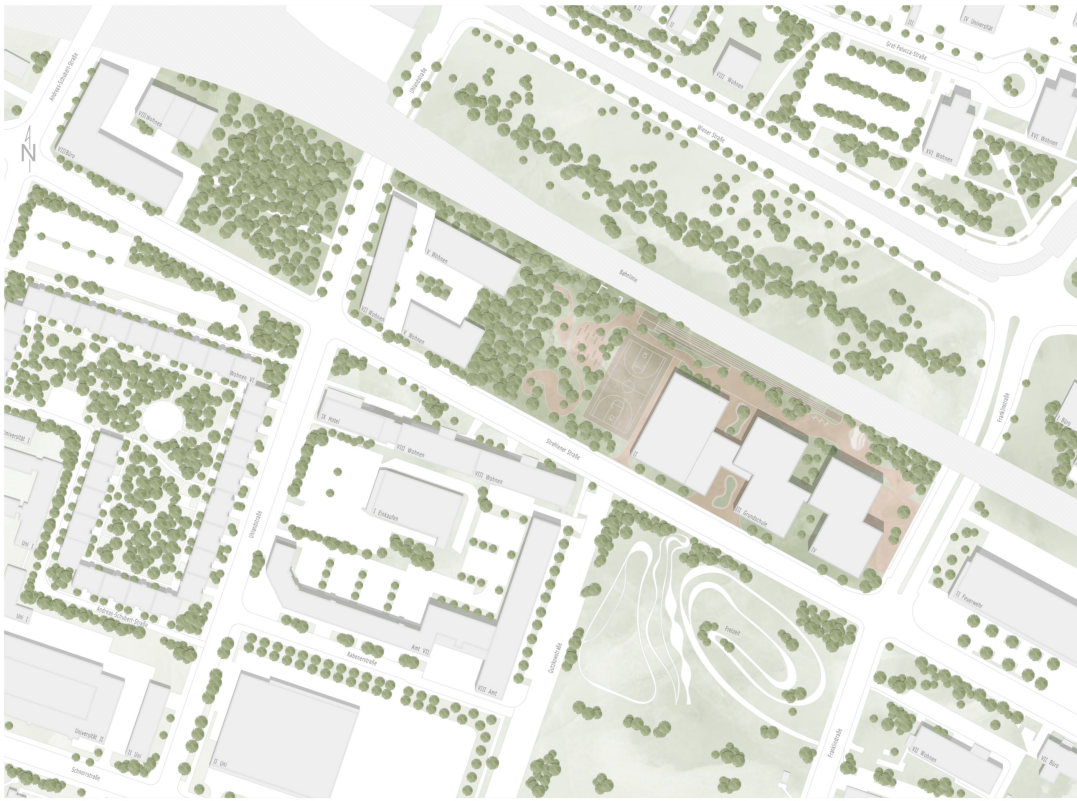
Lageplan M 1_1000