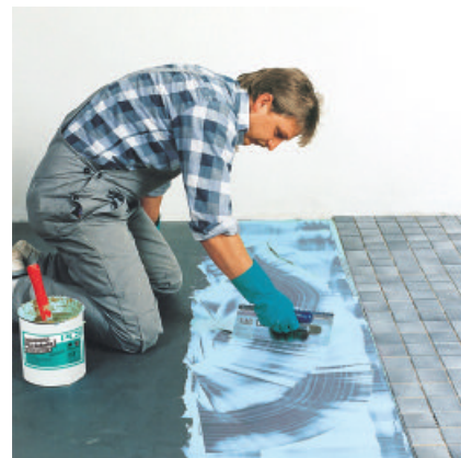
Auch Stahlbleche eignen sich in Verbindung mit PCI Collastic als Verlegeuntergrund.