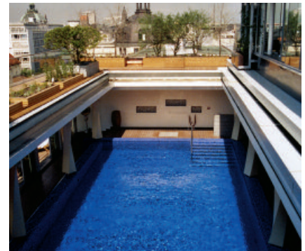
Mit PCI Collastic verlegte Fliesen in einem Schwimmbecken.