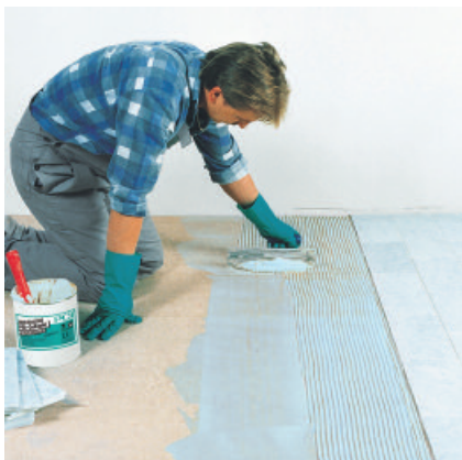
PCI Collastic eignet sich als Fliesenkleber auf feuchtigkeitsempfindlichen Untergründen wie z. B. Holzspanplatten.

8 Bei Lattenkonstruktionen und auf völlig planebenen Untergründen die Streifenklebemethode anwenden. Auf die Lattung bzw. auf die Plattenrückseite ca. 10 cm breite PCI Collastic-Streifen auftragen und mittels Zahnpachtel gleichmäßig dick abziehen.