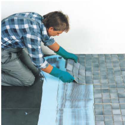
Fliesen oder Platten werden im aufgekämmten Kleberbett angesetzt und ausgerichtet.