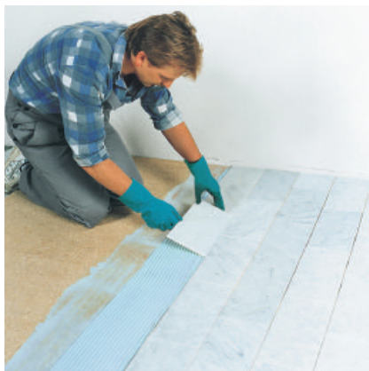
Mit dem Reaktionsharz-Fliesenkleber PCI Collastic kann auch Marmor auf Holzspanplatten verlegt werden.